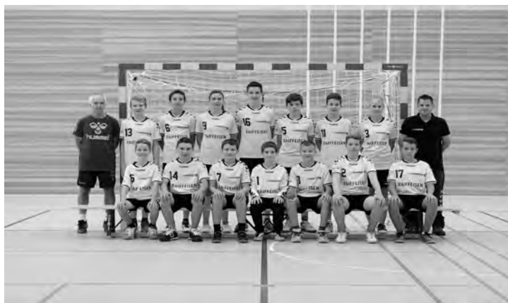
Mannschaftsfoto : U-15 Regio

Übrigens alle Resultate, Tabellen und Spielberichte sind auf unserer neuen Homepage: www.tsvrheinfelden.ch zu finden.